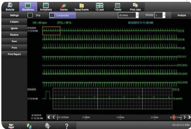
ICS muestra un ECG de 7 derivaciones de AriaTele