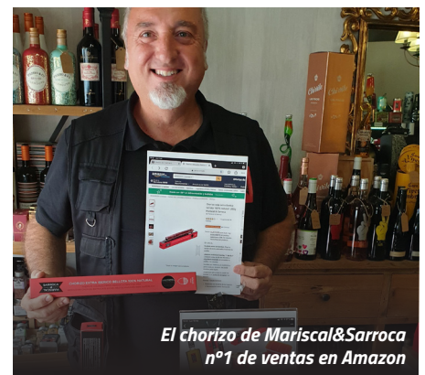
El chorizo de Mariscal&Sarroca n°1 de ventas en Amazon

Un viaje que comenzó el pasado 2016 y del que todavía nos quedan grandes destinos por recorrer. Nuestros siguientes retos conjuntos: lograr el éxito en el Marketplace de AliExpress en la zona euro, que recientemente se ha abierto a la categoría de alimentación seca y exportar a los Emiratos Arabes y a los EE. UU. a través de Amazon.